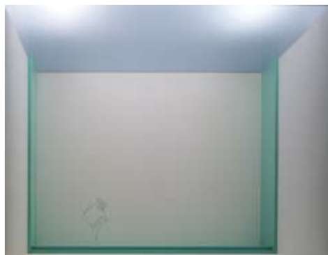
Espacio para 9 con olivo, 2008 , fotografia, 78 x 100 cm.