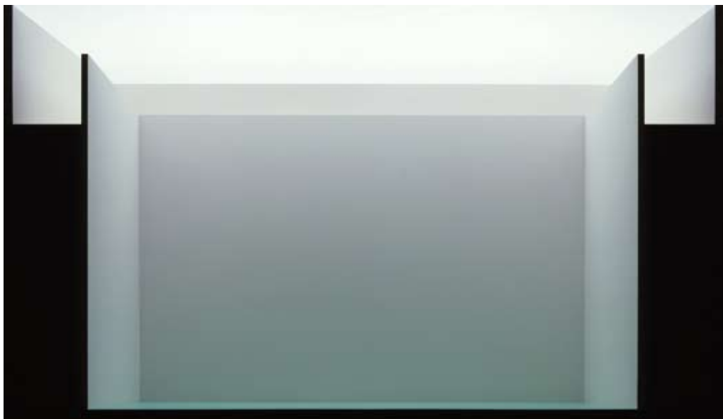
¿Podría permanecer un copo de nieve...? I, 2008, fotografía, 90 x 155 cm.