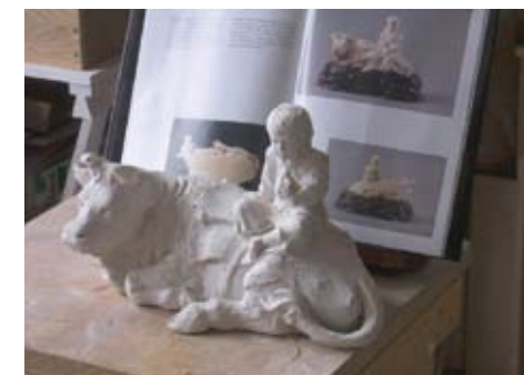
Estudio de un marfil de Gyokuzan y Dai, 2008 yeso, 22 x 38 x 20 cm.