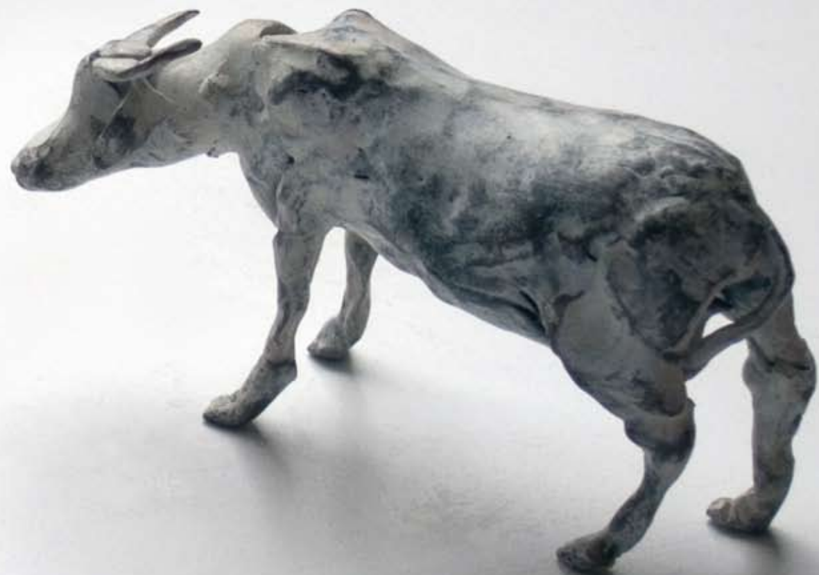
Búfalo, 2007 , bronce, 7,5 x 14 x 4 cm.