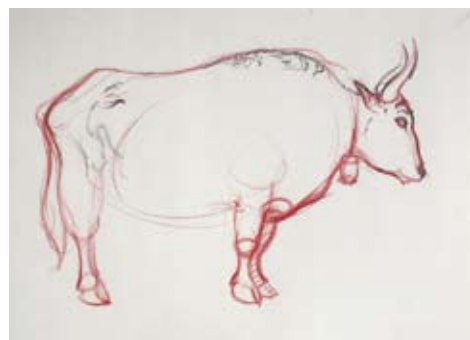
Yok, 2008, lápiz de color y grafito sobre papel 30 x 42 cm.