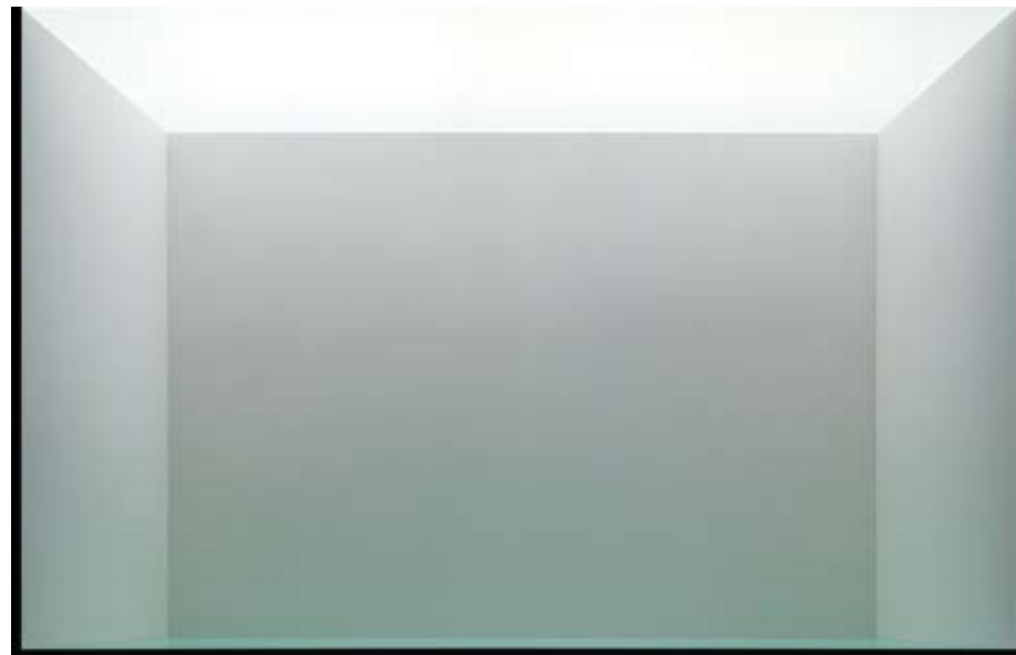
¿Podría permanecer un copo de nieve...? II, 2008, fotografía, 90 x 140 cm.