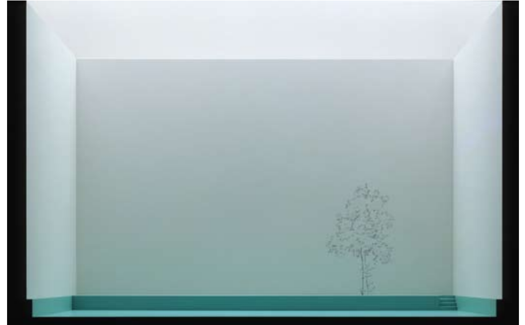
Espacio para 9 con Tilo, 2008 , fotografía, 90 x 141 cm.